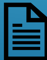
Comentario de texto