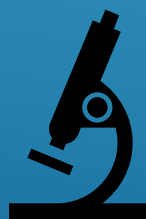
Laboratorio: Salud y Biotecnología