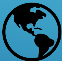
Segunda Lengua Extranjera