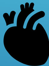
Actividad Física, Salud y Sociedad