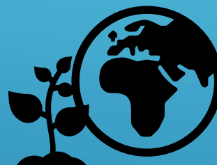
Ciencias de la Tierra y del Medioambiente