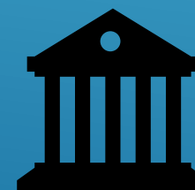
Patrimonio en el aula