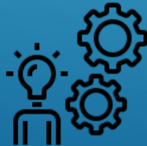
Taller de inventores