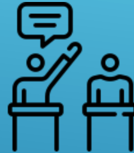
Oratoria y Debate